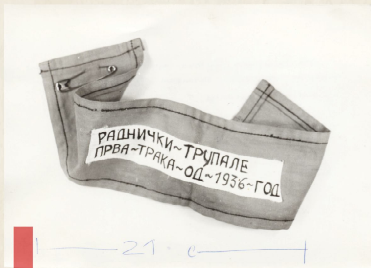
Прва редарска црвена трака дежурних чланова СК "Раднички" Трупале